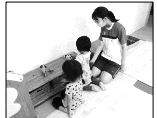
8/5 日川高校・山梨高校(泉保育園)