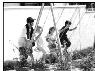
8/6 日川高校 (泉保育園)