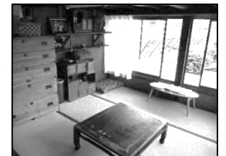
↑2階の秘密の 小部屋！？