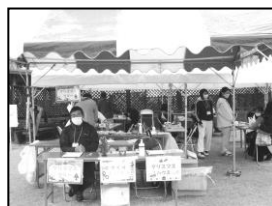
【手作り体験ブース】