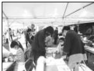
【手作り体験ブース】

11月23日（祝）市役所1Fロビーと塩むすびを会場に、2年ぶりにこうしゅう福祉まつりが開催されました。当日はさわやかな秋晴れのもと、家族連れや障害者など多くの方が来場し、各ブースを担当したボランティアも市民の方と楽しく触れ合いました。