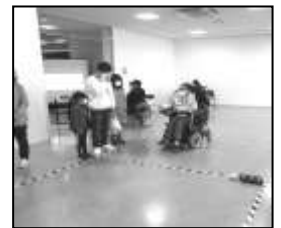
【ポツチャ体験ブース】

かつぬまボランティア会が販売・材料の寄付を募った「復興ぞうきん」にも、多くの方にご協力いただき、たくさんの材料が集まりました。集まった材料は、後日「紡ぎ組」へ送らせていただきました。ありがとうございました。