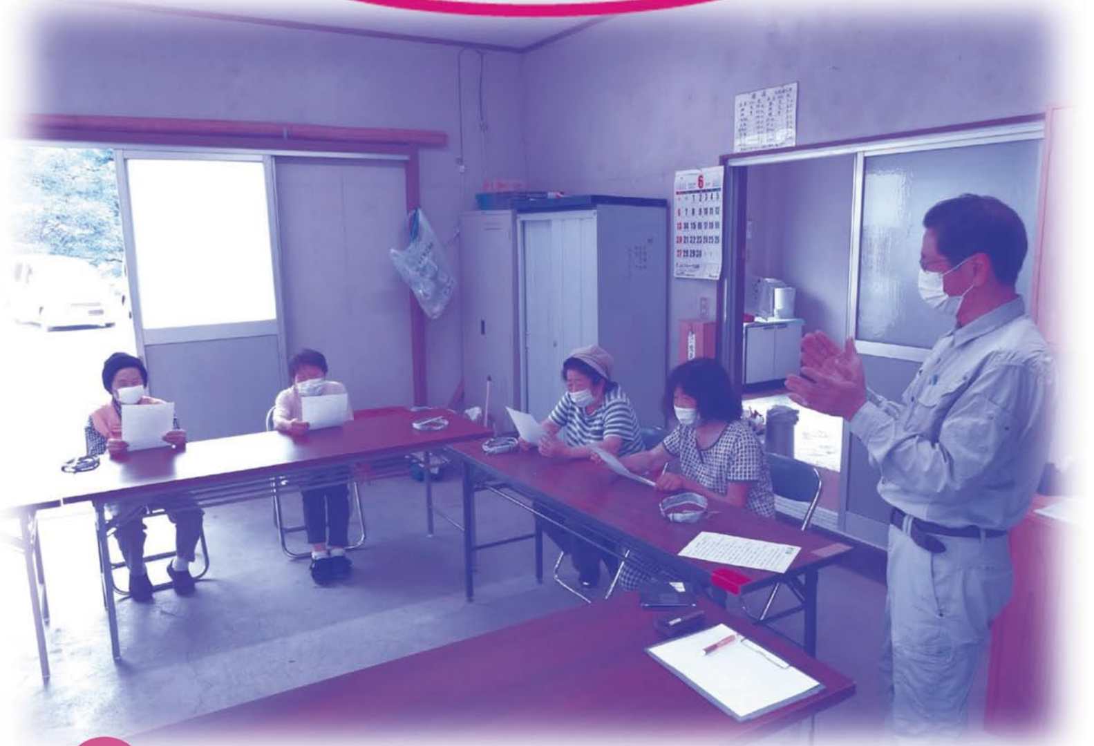
丸林いきいきサロンの活動の様子