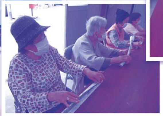
レクリエーションの様子