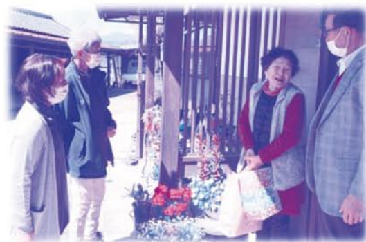
支部活動事業(一人暮らし高齢者親睦事業等)

一般会費 8,822世帯 8,817,500円 賛助会費 311件 1,902,000円