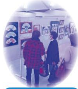
ふれあい交流作品展