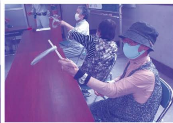
レクリエーションの様子

丸林地区では当番制で定期的集落センターやリサイクルステーションの清掃を住民が行う取り組みをしており、区域外の人を訪れたときは皆、綺麗で驚いているそうです。