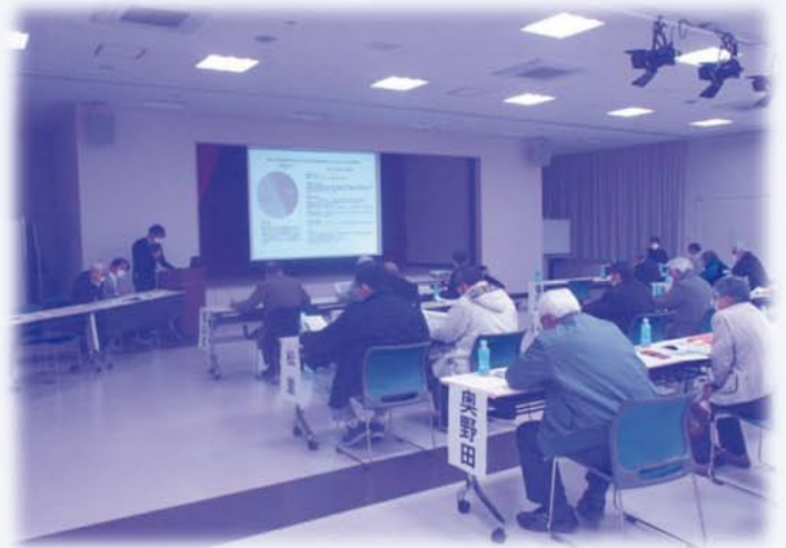
支部全体研修会の様子

尚、今回のアンケート結果はどなたでも甲州市社会福祉協議会ホームページから閲覧いただけます。ぜひ一度目を通してみてください。