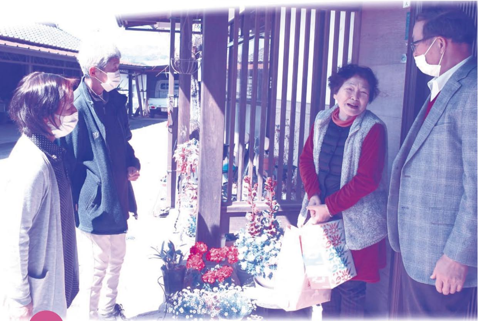
社会福祉協議会塩山北支部 一人暮らし高齢者親睦事業訪問活動の様子