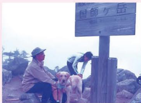
盲導犬と国師ヶ岳へ ~H28.6.22~