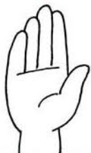
(手)そのものを示す