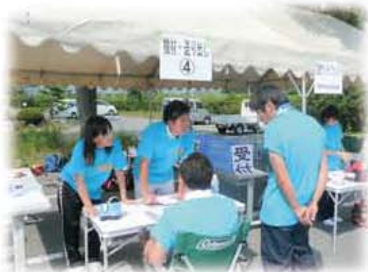
重点配分事業(防災用品整備)