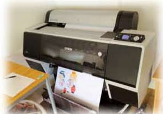
施設配分事業(バナー・横断幕作成セットモデル)