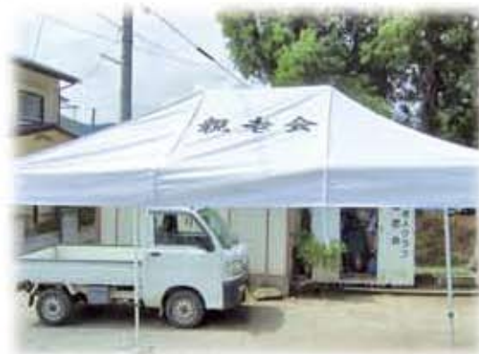
地域特別事業(テント購入)