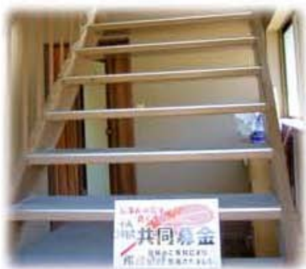
地域特別事業(階段修繕)